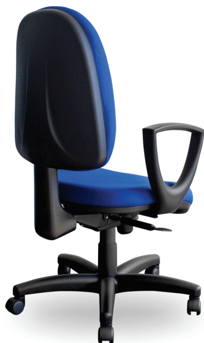
Foto meramente ilustrativa, kit sem tapeçaria.

A linha B-Side tem design ergonômico e tradicional, sendo um dos produtos "Best-Seller" da Rhodes.