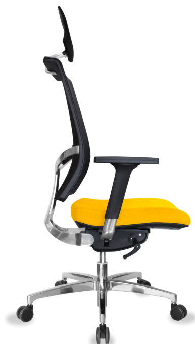
Foto meramente ilustrativa, kit sem tapeçaria.

A linha Shift é tecnológica, moderna e slim com contornos que seguem a curvatura do corpo.